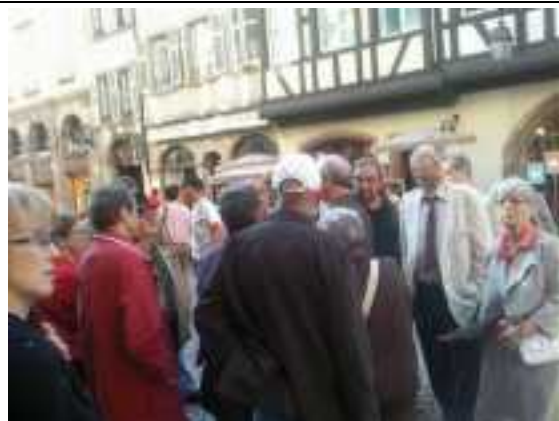
Dans les rues de Strasbourg