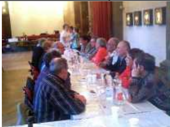
Repas de travail