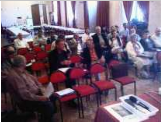
Vue de l'assemblée générale