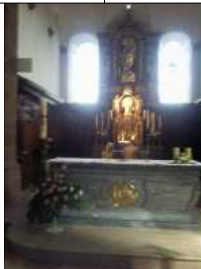
Tombeau de Sainte-Odile