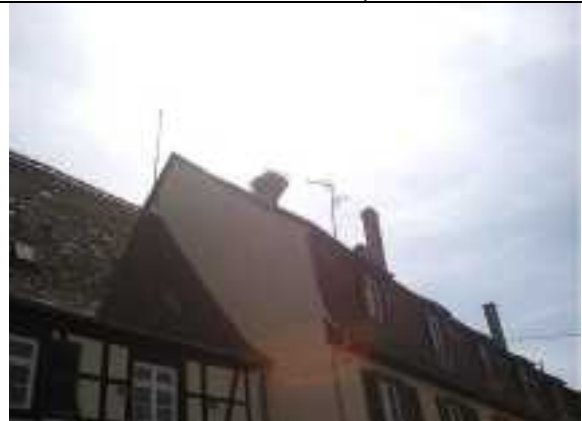
Nid de cigogne