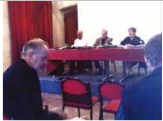
Le bureau de la F.F.A.G.C.P.