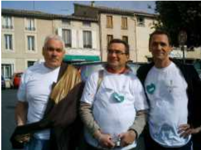
Transplanté le 22 juillet 2008, c'est avec