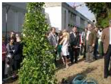
Le Ginkgo Biloba