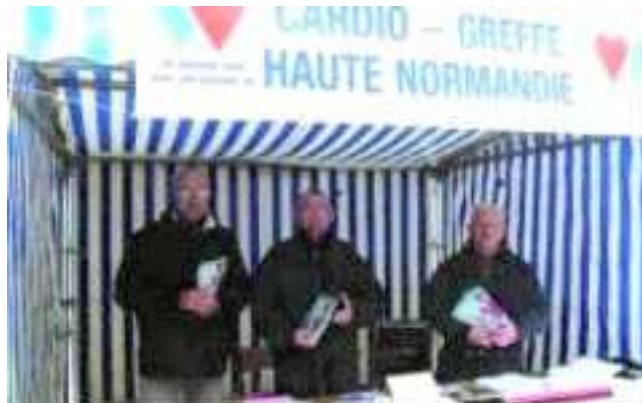
Le stand à Fécamp