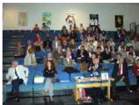
Vue des participants

Après cette projection, la parole a été donnée afin de témoigner à des bénévoles de l'ADOT et à des transplantés.