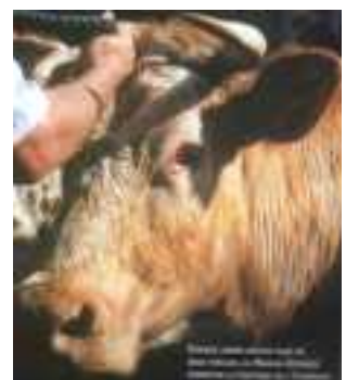
Chaque année depuis plus de deux siècles, le Marais-Vernier perpétue la coutume de l'étampage