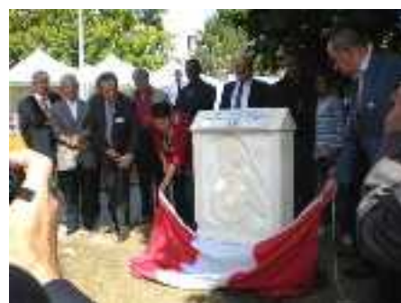
Inauguration de la stèle