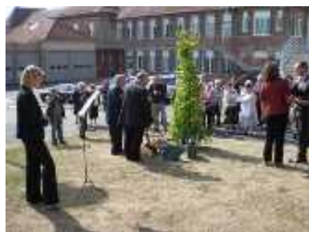
Plantation du Ginkgo Biloba

Après cette première partie des cérémonies, des autocars ont transporté les participants au Centre hospitalier de Beauvais. Symboliquement face au bâtiment de l'école d'infirmières, un Ginkgo Biloba a été planté (on va le considérer comme un cousin de celui de la cour intérieure de Charles-Nicolle !) et une très belle et élégante stèle en l'honneur des donneurs a été dévoilée, notamment très symboliquement par une transplantée cardiaque, accompagnée d'une mélodie de l'opéra Orphée de Glück interprétée à la flûte par une jeune femme musicienne et conseillère municipale de Beauvais.