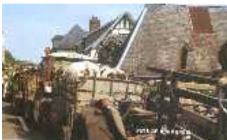
Dans la remorque, une ou deux bêtes attendent leur tour

Au Marais-Vernier limitrophe de Ste Opportune, village magnifique au printemps avec ses pommiers en fleurs ses toits de chaume, le 1er mai de chaque année a lieu la fête de l'étampage. Tradition née au temps de la révolution, lorsque les terres seigneuriales furent confisquées et devinrent biens communaux. Le village reçut ainsi plusieurs centaines d'hectares de vertes prairies. Une manne pour ces paysans du cru. Mais fallait-il pouvoir identifier le bétail avant de le laisser paître à loisir. D'où le recensement des bovins appartenant aux éleveurs de la commune au début du printemps, suivi du marquage ou étampage, avant la mise au pré. On utilise des fers rouges qu'on applique sur les cornes, donc insensibles et indolores avec les initiales M.V. : Marais-Vernier.