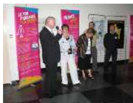
Témoignage de greffés

A noter parmi les greffés picards qui témoignaient un transplanté cardiaque au C.H.U. de Rouen.