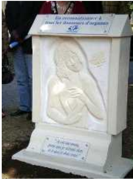
Stèle en l'honneur des donneurs (A cet inconnu pour qui je n'étais rien et à qui je dois tout)

Nous sommes ensuite revenus à la salle de réunion des manifestations matinales pour un déjeuner avec tous les participants. Nous avons eu le plaisir d'avoir à notre table la dame transplantée cardiaque (à Paris) qui a dévoilé la stèle, très sympathique et très vivante.