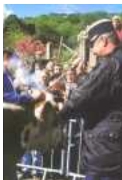
Fer en main, invités et personnalités locales se succèdent pour marquer les cornes des animaux