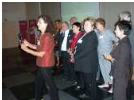
L'équipe de l'ADOT 60