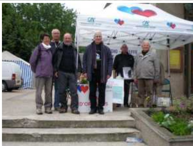
Sur le marché des Andelys le 22 juin