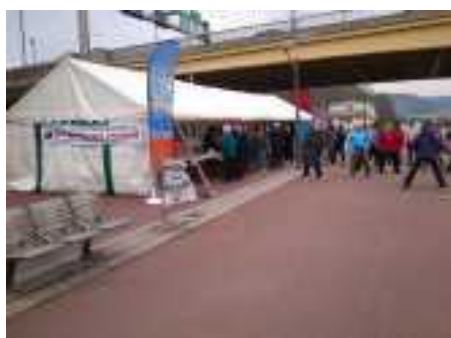
A Rouen sous le pont Guillaume-le-Conquérant