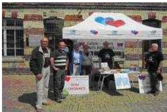
A Montivilliers le 20 juin