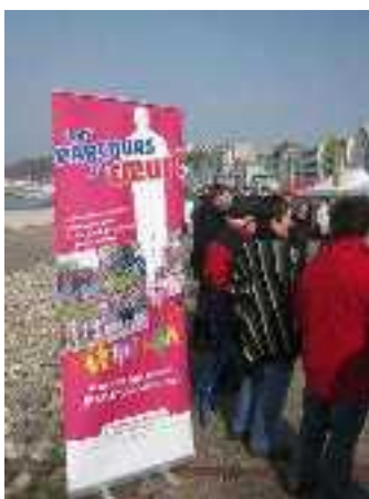
Sur la plage du Havre