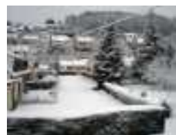
Normandie 2 janvier 2010

Eyer : voir ; Caouan : Chouette effraie ; Fache : visage ; Sanger : changer ; Mouvoir : remuer ; Quainer les rœs : chaîner les roues ; Mon cul ma qu'minse : cul et chemise ; Quiens d'traîneux : chiens de traîneaux ; Piéter : marcher à pied ; Bourre empaturée : canne entravée ; Régobinder : ragailardir ; Revif : nouvelle vigueur ; Creuser l'boudin : donner faim ; Se liter : se mettre au lit ; Se déliter : se lever du lit ; Dreit l'matin : tôt le matin ; Kiseux : skieurs ; Désennuyer : distraire.