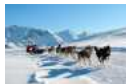
Chiens de traîneaux