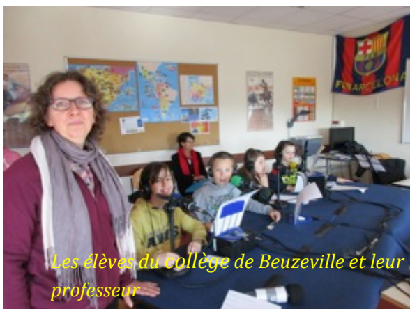
Les élèves du collège de Beuzeville et leur professeur