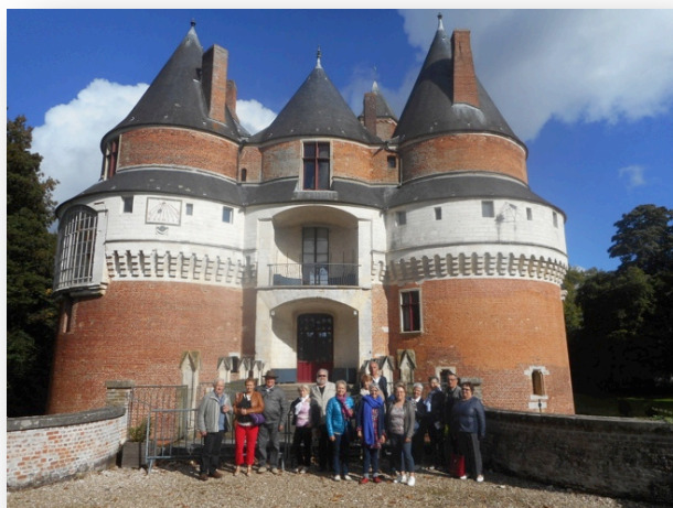
Le groupe de CGHN devant le château de Rambures