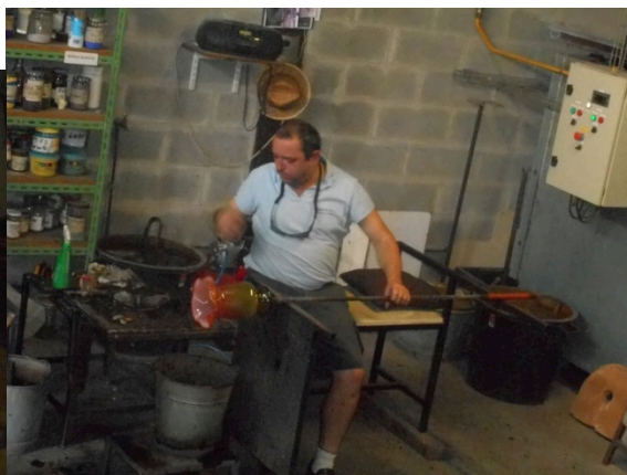
Les gestes précis et experts du souffleur