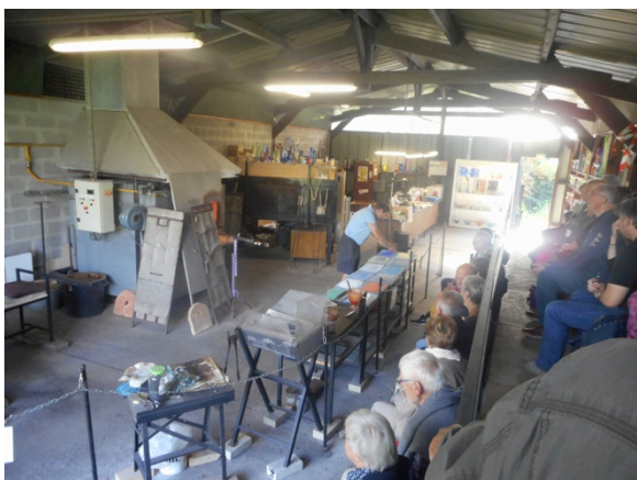
Le public est bien installé, la démonstration peut commencer

L'appel de notre estomac nous a dirigés vers la « Gwentry » à BLANGY.