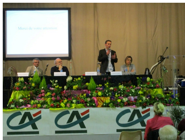
Les invités du Crédit Agricole à la tribune

Pierre, lors de son témoignage, à l'évidence très convaincant.