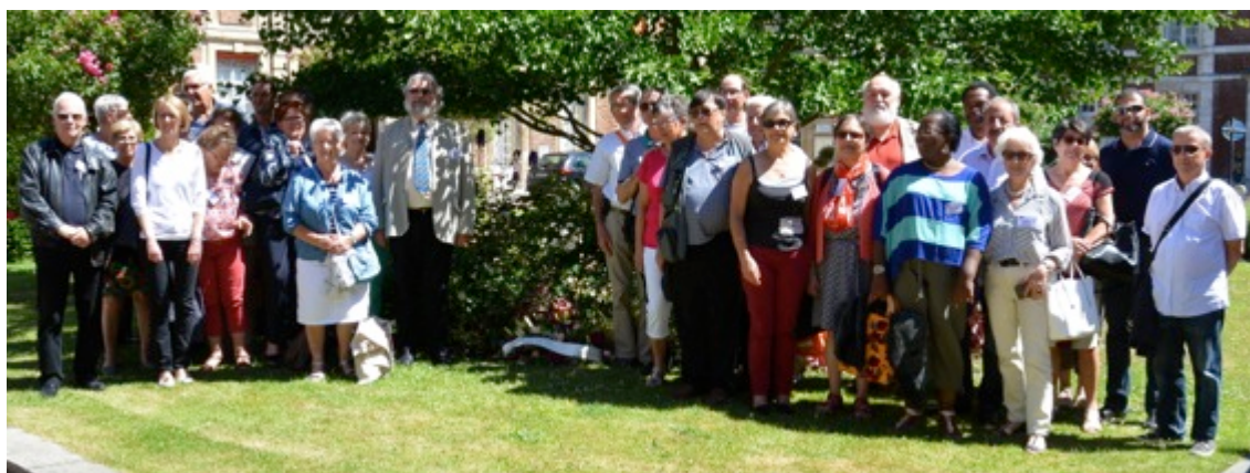
Les congressistes réunis dans la cour d'honneur du CHU, devant le Gingko Biloba.