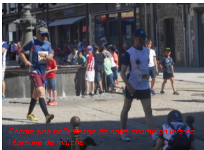
Encore une belle image de notre champion lors de l'épreuve de marche