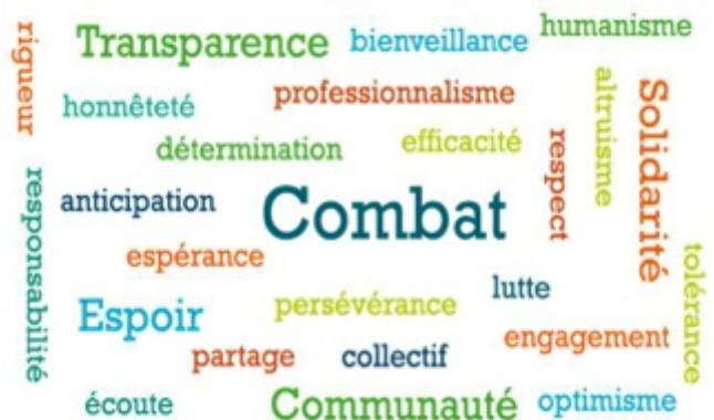
Les valeurs de « Vaincre la mucoviscidose »

L'association finance 77 projets de recherche pour 3.4 M€ tous obtenus par la générosité du public.