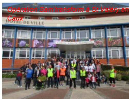
Opération Sam'transforme à St Valéry en Caux

A lire : Brochure Attendre la greffe en toute sérénité