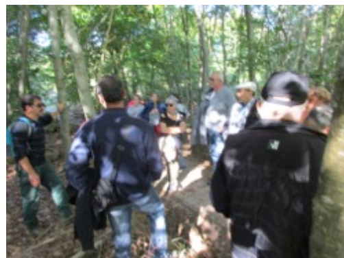
Sortie en Forêt Domaniale d'EAWY