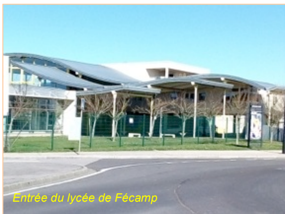
Entrée du lycée de Fécamp

Le lycée de FECAMP groupe le lycée général Guy de Maupassant et le lycée technique Descartes. C'est un lycée public qui regroupe 1800 élèves, il prépare aux bacs généraux et aux BTS de maintenance des systèmes, Management commercial et Technico-commercial.