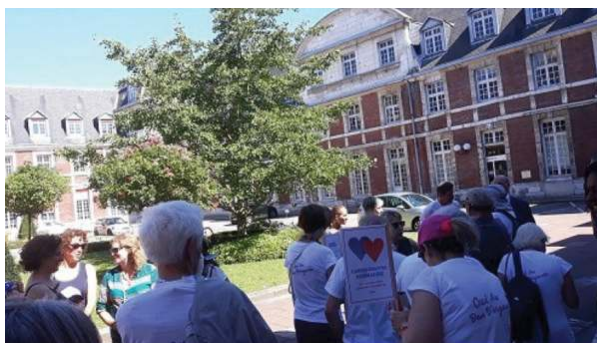
Arrivée cour d'honneur du CHU Le Gingko biloba