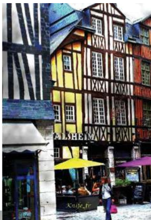
Rue Damiette, lors de notre déambulation dans ROUEN