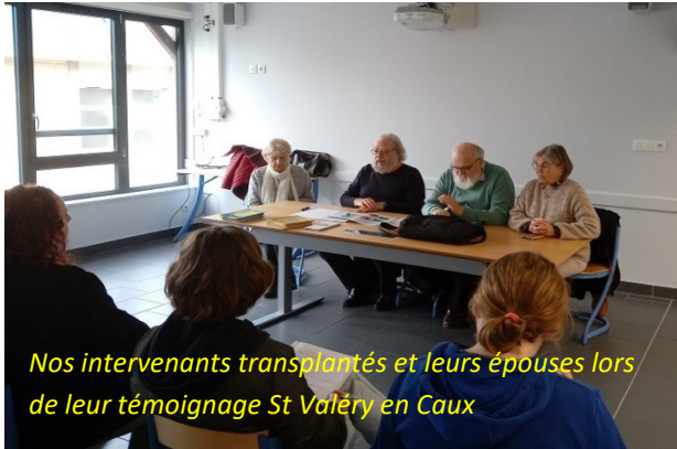
Nos intervenants transplantés et leurs épouses lors de leur témoignage St Valéry en Caux

Il existe également un CAPA service aux per-