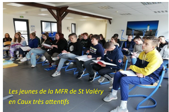
Les jeunes de la MFR de St Valéry en Caux très attentifs