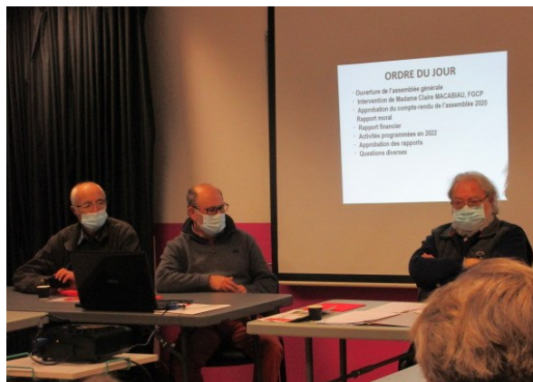
Les membres du bureau lors de la présentation de l'ordre du jour.

Enfin, nous sommes dans l'attente d'une décision du rectorat quant au renouvellement de notre agrément. Le dossier a été déposé en fin d'année dernière, toujours pas de réponse à ce jour, la commission ne se réunissant qu'une fois par an maintenant