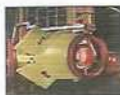
Inverseur de poussée (HSA)