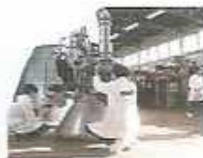
Maquette du moteur d'Ariane 5 (SNP)

Les activités s'étendent aux moteurs aéronautiques et spatiaux toujours autour de la même thématique (contrôle de la combustion), notamment en collaboration avec le site de Vernon de la SNECMA (SNP) qui fabrique les moteurs de la fusée Ariane et Hispano-Suiza Aérostructures (HSA) et l'Université du Havre qui ont entamé une collaboration étroite dans le domaine des matériaux composites à matrice polymère, pour les inverseurs de poussée des moteurs d'avion à l'atterrissage qui subissent de très fortes contraintes mécaniques et thermiques.