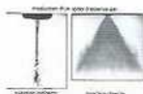
Production d'un spray d'essence par injection indirecte (gauche) et injection directe (droite) (CORIA)

Les activités s'étendent aux moteurs aéronautiques et spatiaux toujours autour de la même thématique (contrôle de la combustion), notamment en collaboration avec le site de Vernon de la SNECMA (SNP) qui fabrique les moteurs de la fusée Ariane et Hispano-Suiza Aérostructures (HSA) et l'Université du Havre qui ont entamé une collaboration étroite dans le domaine des matériaux composites à matrice polymère, pour les inverseurs de poussée des moteurs d'avion à l'atterrissage qui subissent de très fortes contraintes mécaniques et thermiques.